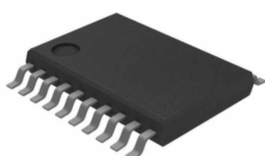
Image өкүлчүлүгү болушу мүмкүн. өнүмдүн чоо-жайын билүү үчүн техникалык карагыла.