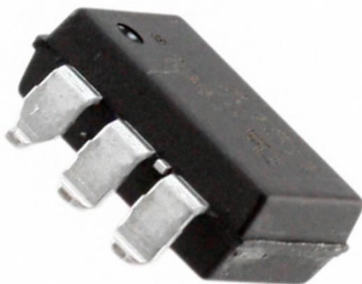
Image өкүлчүлүгү болушу мүмкүн. өнүмдүн чоо-жайын билүү үчүн техникалык карагыла.